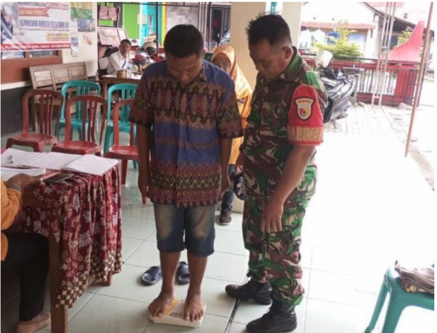
Pentingnya Menjaga Kesehatan, Babinsa Koramil 0804/08 Barat Dampingi Posyandu Jiwa di Desa Binaan