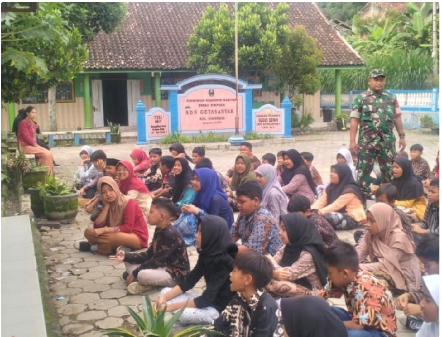
Kedisiplinan Kunci Kesuksesan, Bati Komsos Posramil Sidorejo Melatih PBB dan WASBANG Siswa SDN 1 Getasanyar

Magetan. - Bati Komsos Posramil Sidorejo Koramil Tipe B 0804/02 Plaosan Serma sadino bersama Babinsa memberikan pelatihan peraturan Baris Berbaris (PBB) dan wasbang kepada siswa-siswi SDN 1 Getasanyar Kecamatan Sidorejo