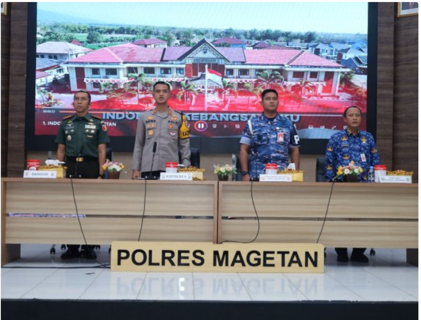
Dandim 0804/Magetan Hadiri Rakor Lintas Sektoral kesiapan operasi lilin 2024

Magetan. – Guna meningkatkan Sinergitas dalam rangka kesiapan operasi lilin 2024 pengamanan Hari Raya Natal 2024 dan Tahun Baru 2025 di wilayah Kabupaten Magetan yang aman dan kondusif.